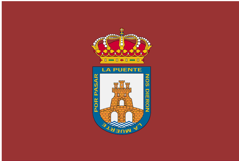
Escudo 2/3 de la anchura de la Bandera centrado