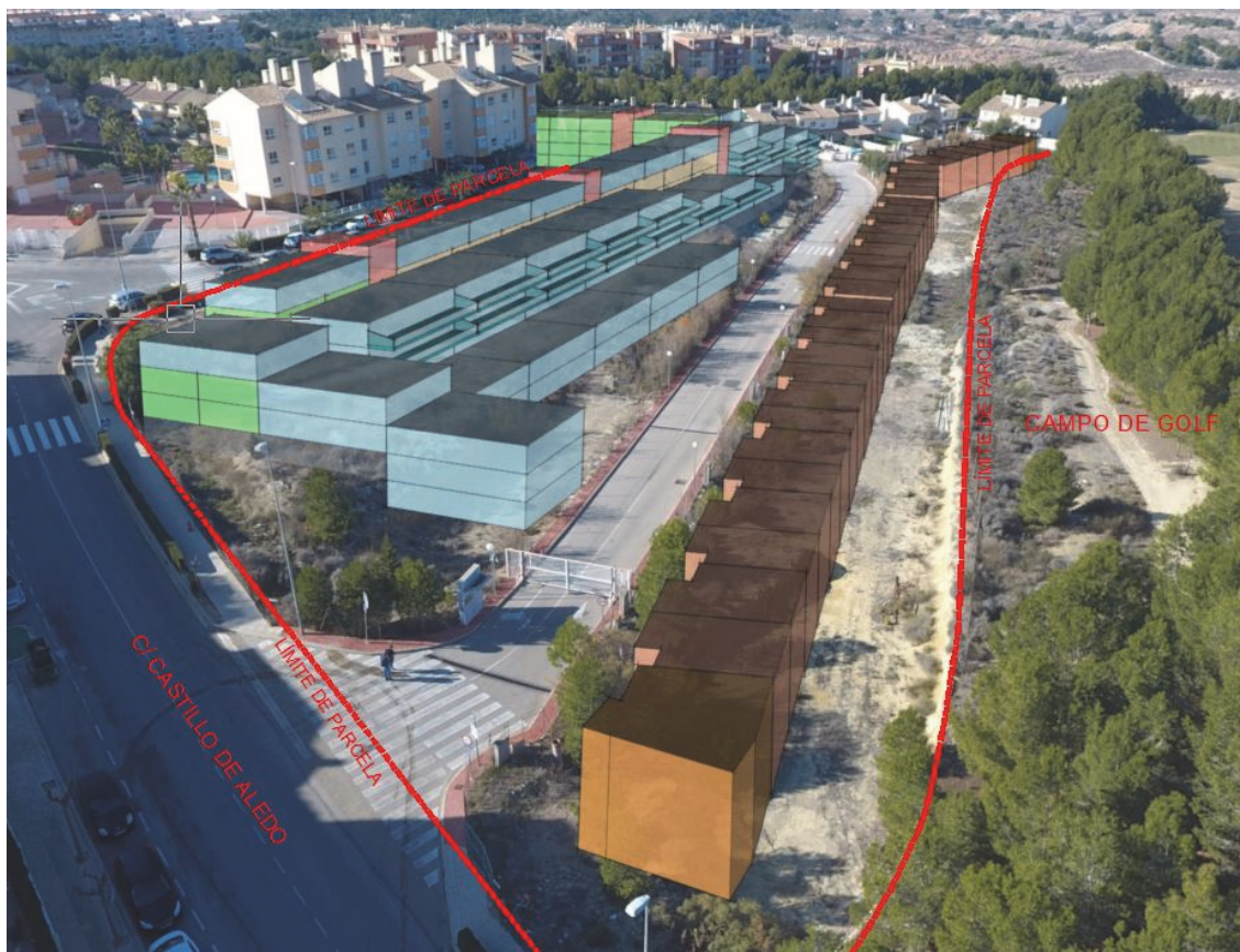
Esquema n.º 2A:

Los cuerpos abiertos de terrazas podrán volar a ambos lados del cuerpo edificado, conforme los siguientes esquemas planteados y volumetrías que se aportan, independientemente de la planta en la que se encuentren, siendo dichos vuelos recayentes sobre el interior de la parcela. Las terrazas que sobresalen de los cuerpos de la edificación en altura y vuelan sobre plantas inferiores, según esquemas adjuntos, no consumen superficie ocupada de parcela, y a efectos del cómputo de edificabilidad estarán sujetas al P.G.M.O. vigente.