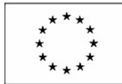
Unión Europea Fondo Social Europeo