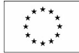
Unión Europea Fondo Social Europeo